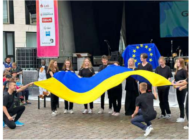
Вистава «Діти війни». Ольденбург. Липень 2023 р.